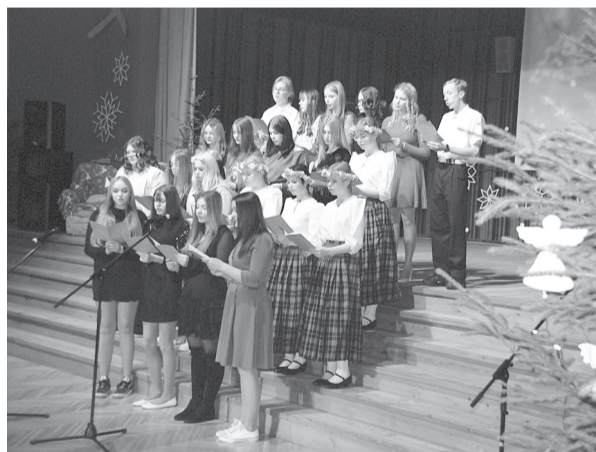
Arī Cesvaines vidusskolā izdevās izjust Ziemassvētku noskaņu – svētku tuvošanās jaušama skolēnu un pedagogu izspēlētājās eņģēs