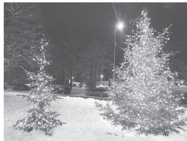
Par svētku tuvošanos liecināja arī Cesvaines pošanās svētku rotā. Galvenā svētku varone eglīte – ierasti Cesvaines centrā