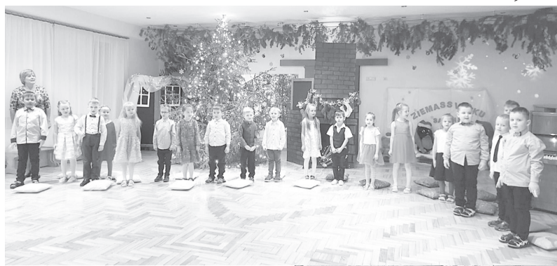
Pirmsskolas izglītības iestādē „Brīnumzeme” nosvinēta Ziemassvētku atnākšana – katra grupiņa sagatavojuši priekšnesumu

Japānas noskaņās Cesvaines pils noslēdzās kimono izstāde: uzzinājām, kā veidot bonsai, locīt origami, vērojām samuraju zobenu priekšnesumus, izzinājām austrumu kultūru. Nu kimono uzsākuši ceļu uz Japānu