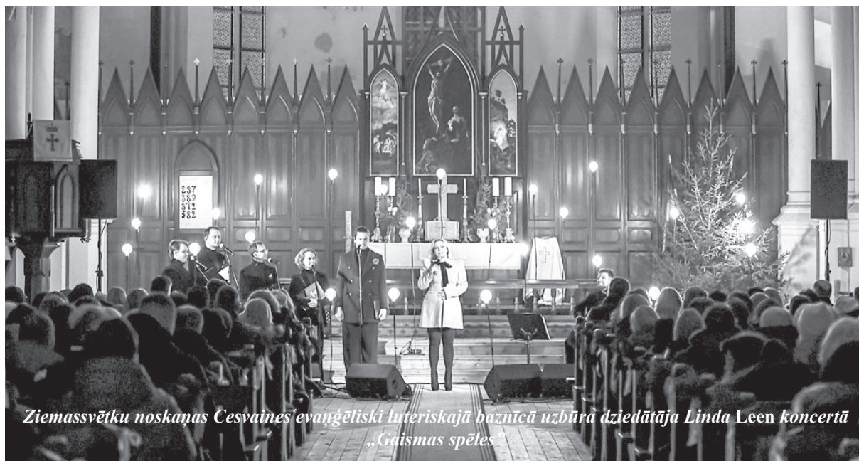
Ziemassvētku noskaņas Cesvaines evaņģēliski luteriskajā baznīcā uzbūra dziedātāja Linda Leen koncertā „Gaismas spēles”