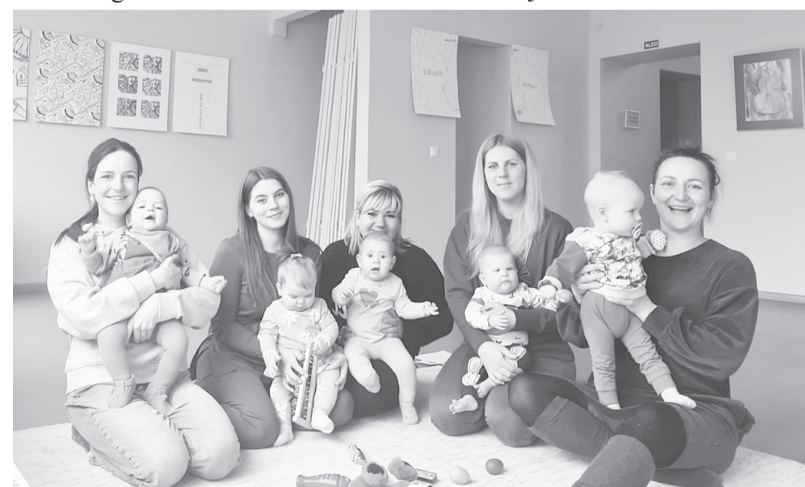
Bēbīšu skoliņas audzēkņi.