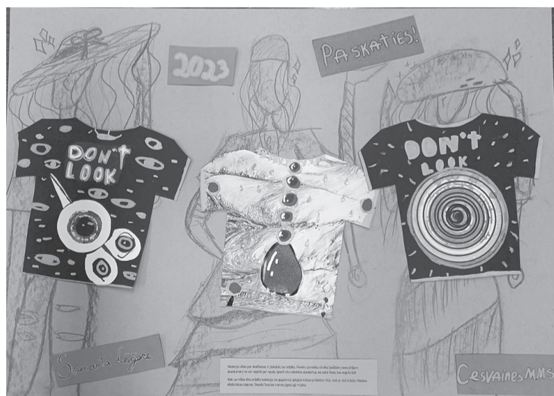
Samantas Lēģeres valsts konkursa darbs