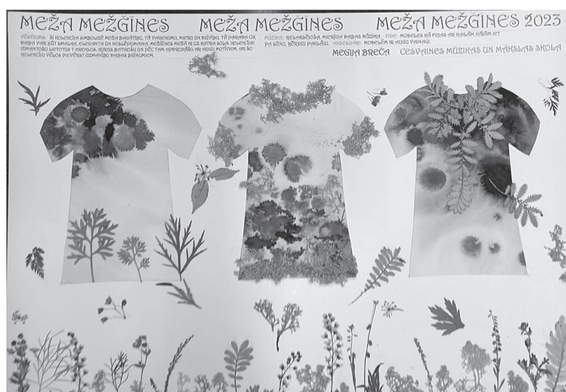
Megijas Brečas valsts konkursa darbs